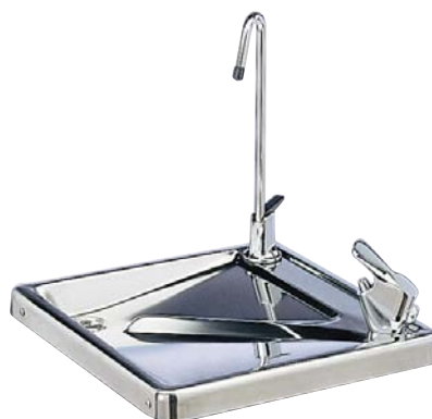
G 63-61 m/footpedal