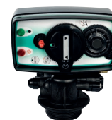
Automatik Midi-Maxi Vattenmätarstyrd