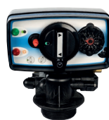
Automatik Midi-Maxi Tidsstyrd