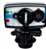
Automatik Midi-Maxi Tidsstyrd