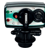
Automatik Midi-Maxi Vattenmätarstyrd